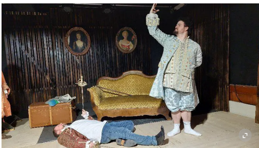
«Les quatre doigts et le pouce», dans une mise en scène signée Jean Chollet.

Si je dirigeais une grande salle, j'aurais monté un grand Morax pour lui tirer un grand coup de chapeau! Mais j'ai créé un théâtre de poche... Cette pièce courte, enlevée, était donc idéale pour Le Bateau-Lune.